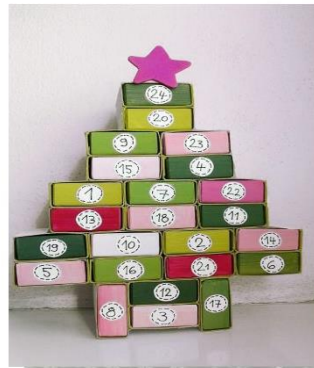
Красиво обклеенные спичечные коробки