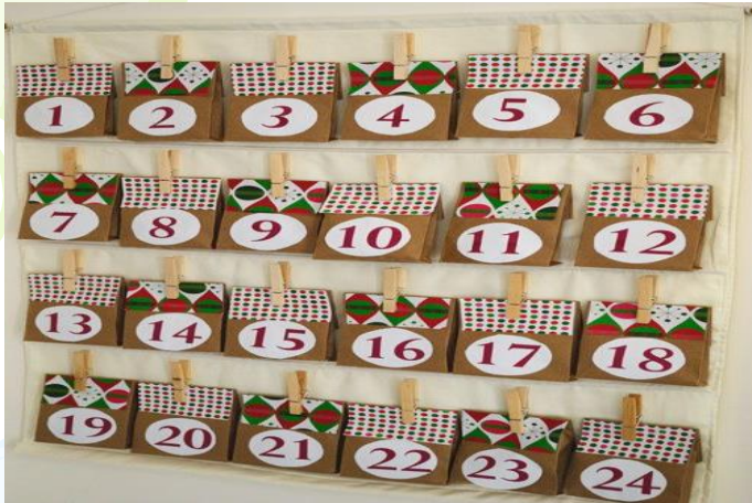
Красиво оформленные конверты