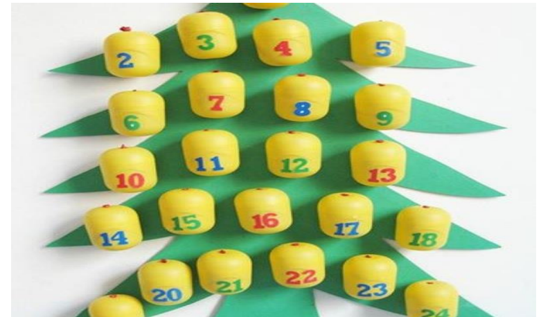
Капсулы из киндер сюрпризов