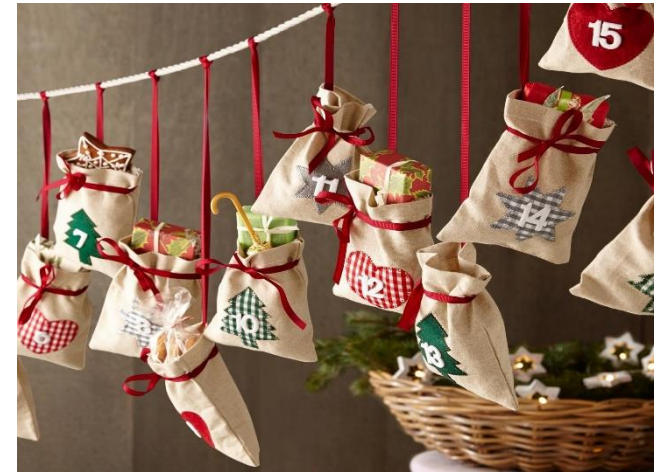
Мешочки, сшитые из ткани на завязочках